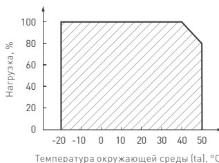
Рис. 2. Максимальная допустимая нагрузка, % от мощности источника.